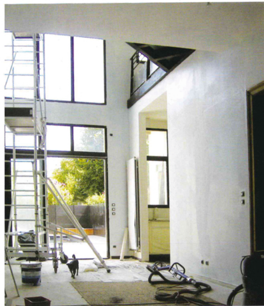
La double hauteur permet de récupérer la lumière.