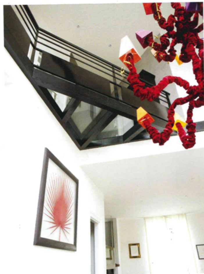
Le puits de lumière couvert d'une dalle de verre permet la diffusion de l'éclairage naturel jusqu'au niveau le plus bas.

parquet contrecollé a été retenu et, s'il est moins cher que le parquet massif, le contrecollé n'en est pas moins beau. En règle générale, sa partie supérieure (la couche d'usure) est faite d'essences nobles de 2,5 à 6 mm d'épaisseur tandis que sa partie cachée est en latté de bois contreplaqué, contre parement en sous face pour stabiliser l'ensemble. Ici, le wengé, bois exotique venu d'Afrique, connu pour sa couleur intense et foncée, habille élégamment les lieux. Chaque salle de bains est personnalisée, les modestes salles d'eau d'antan ont laissé place à d'authentiques pièces à vivre. Ethnique ou zen... Chacune a son cachet.