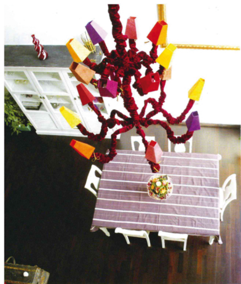
La salle à manger, qui donne sur la piscine, est un lieu de convivialité. Une fois l'aménagement terminé il manquait la touche de gaieté qu'apporte le lustre multicolore.