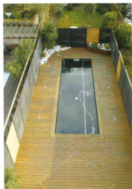
La piscine de 8 x 3 m est en blocs à bancher.