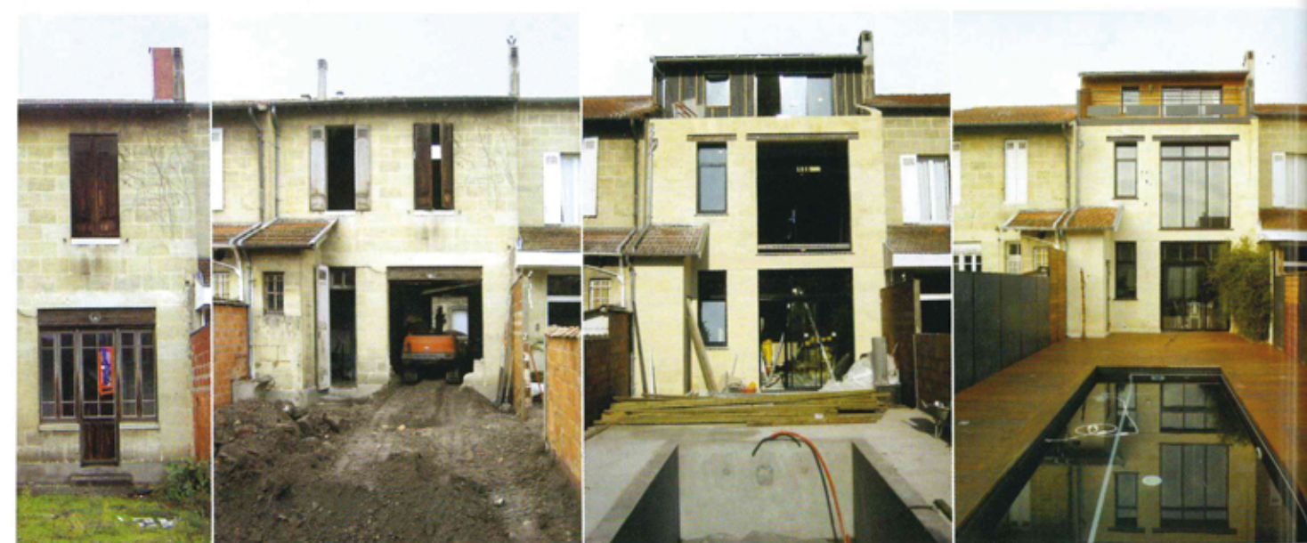
Intérieur, un ravalement des murs en pierres a été réalisé et un bardage en red cedar a été posé au dernier étage.

C'est à Bordeaux, dans le quartier résidentiel du Caudéran aussi surnommé le « Neuilly bordelais », que se situe cette maison de 240 m 2 orientée est-ouest. Le propriétaire, désireux de restaurer le lieu, a fait appel à un architecte afin d'évaluer son potentiel et d'envisager au mieux les travaux.