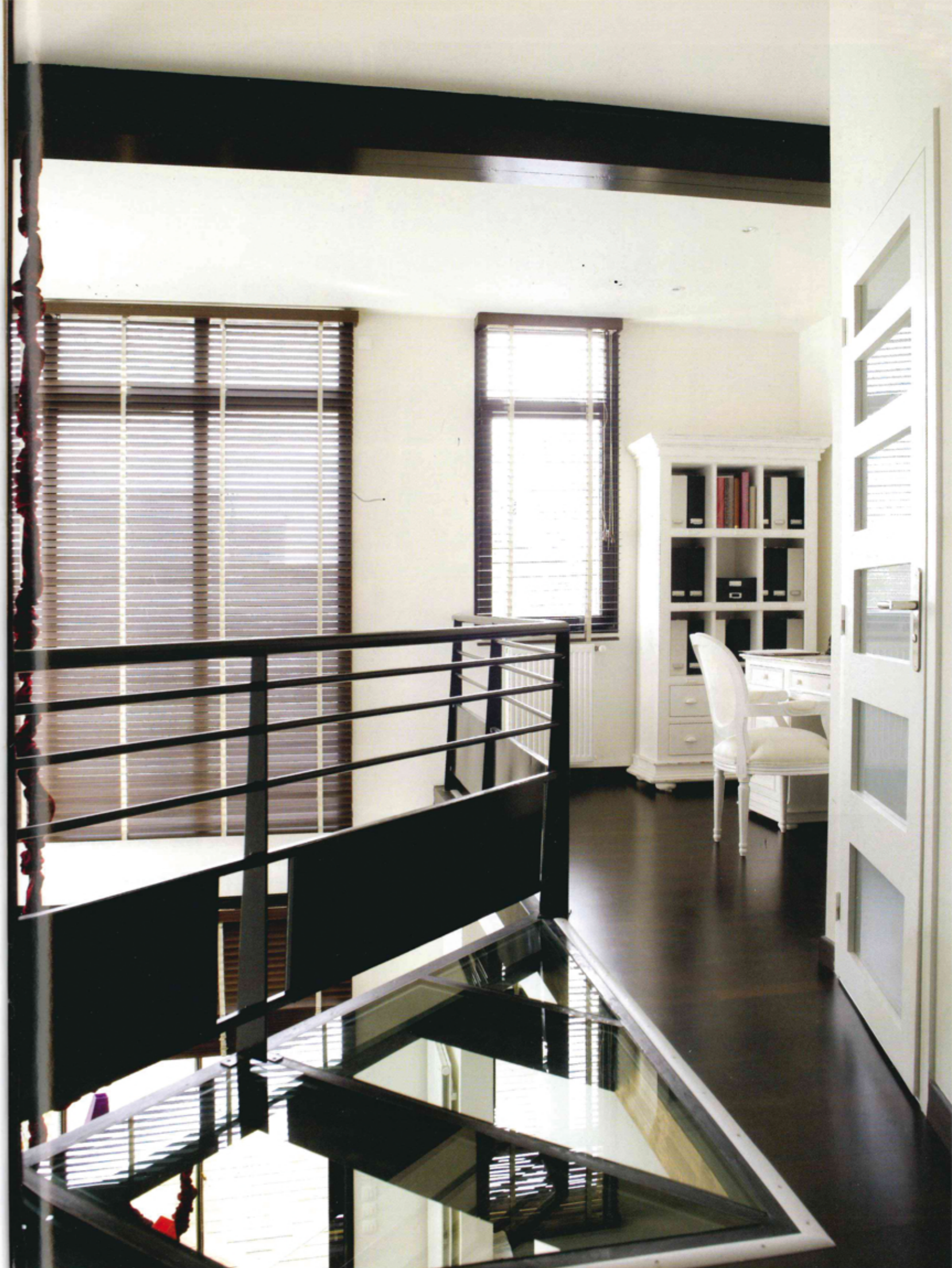
Le garde-corps est en acier peint en noir.

À l'extérieur, la piscine est carrelée avec de la mosaïque noire sur laquelle des lignes blanches ont été tracées afin de pouvoir apprécier la profondeur (1,50 m). La terrasse