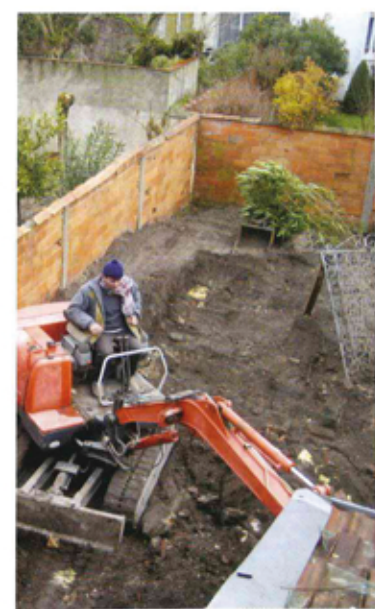
Le terrassement, le périmètre du bassin a été tracé et l'on détermine la surface à creuser, laquelle inclut un dégagement permettant l'accès aisé du réseau de canalisations.