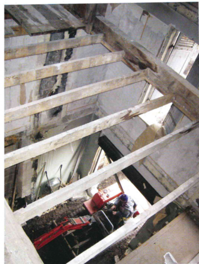
Le plancher par solivage peut être de deux types : avec des solives apparentes, il est particulièrement esthétique, en revanche lorsqu'elles sont cachées elles permettent de loger toutes sortes de gainages techniques.