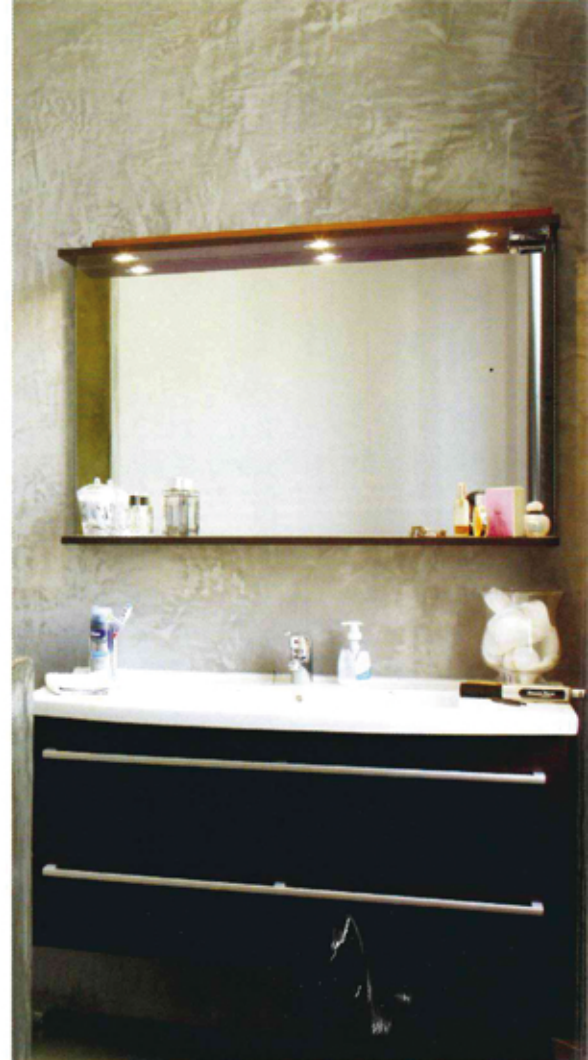
La salle de bains attenante à la chambre est « zen » et raffinée.