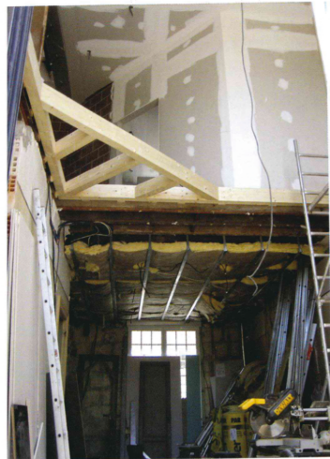
l'isolation est en laine de verre et Placoplâtre® sur rail et la maison est chauffée au gaz.