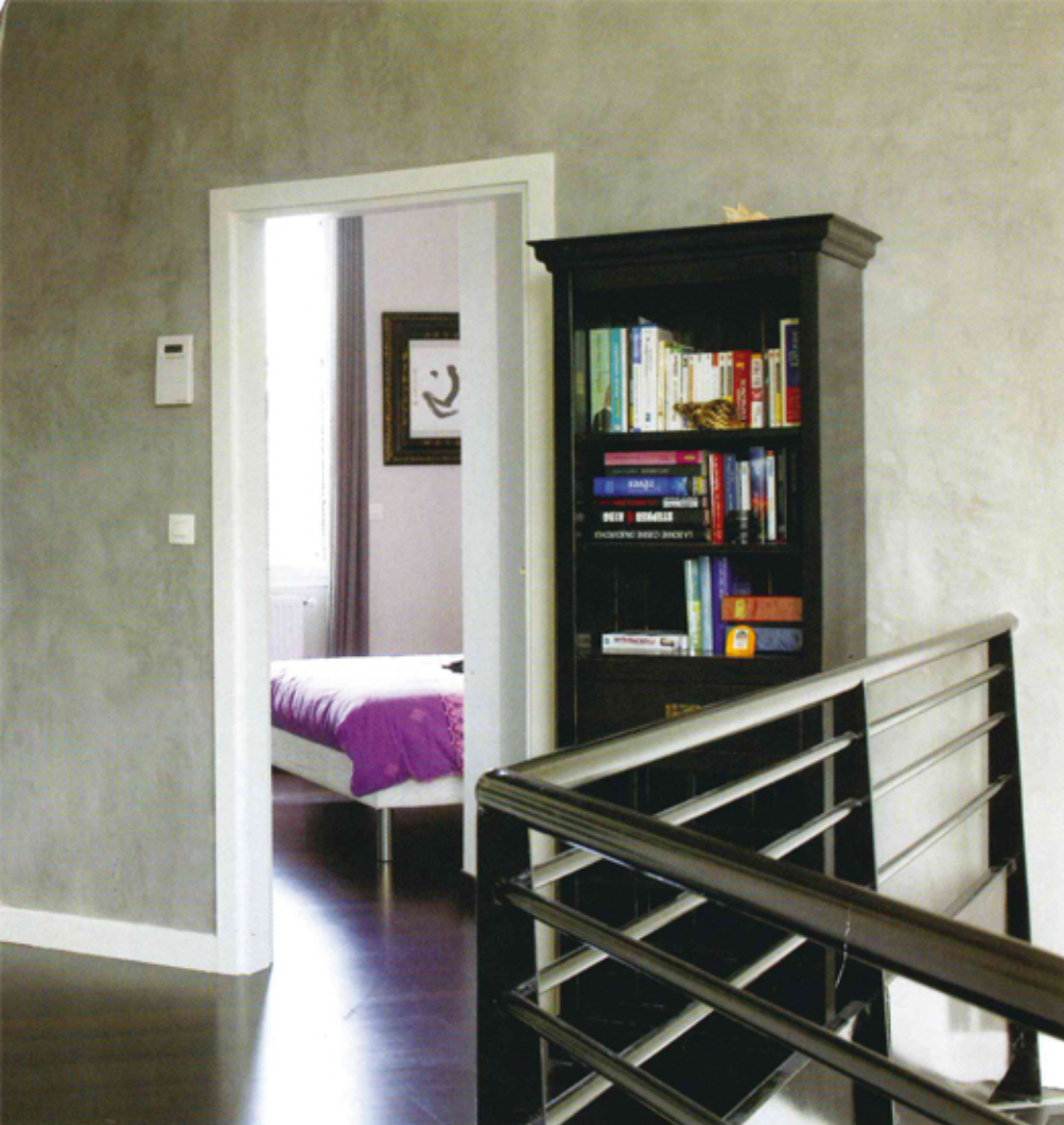
Le mur gris est un stuc ciment verni. Il reste, par sa dureté hydraulique, l'enduit idéal des sols et des surfaces exposés aux chocs.